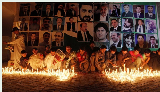
Moment de recueillement après l'attentat de Quetta le 8 août 2016.

Puis, le 8 août 2016, une bombe décima le barreau en tuant 70 avocats rassemblés devant l'hôpital de la ville après l'assassinat de leur Bâtonnier quelques heures plus tôt. Au total, ce sont quelques 150 des 280 avocats du Baloutchistan qui ont été tués ou blessés le 8 août à Quetta.