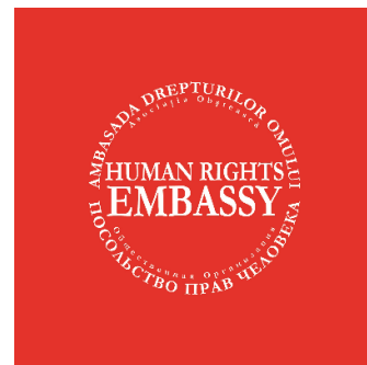
Human Rights Embassy