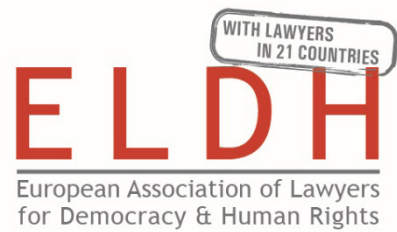
European Association of Lawyers for Democracy and World Human Rights (ELDHR)