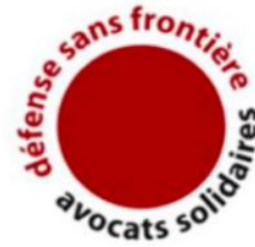
Avocats solidaires – Défense sans frontières