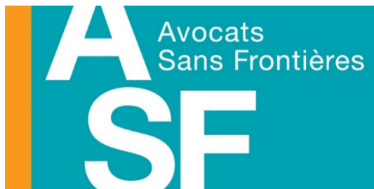
Avocats sans Frontières (Belgique)