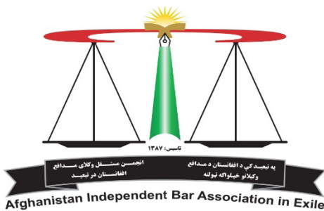
Afghanistan Independent Bar Association In Exile (AIBAIE)