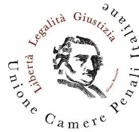
Unione delle Camere Penali Italiane Union of the Italian Criminal Chambers