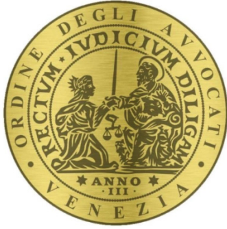
Ordine degli Avvocati di Venezia Venice Bar Association (Italy)