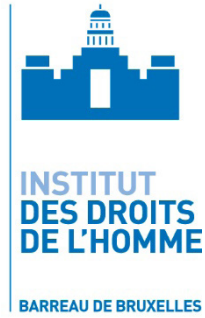
Institut des droits de l'homme du barreau de Bruxelles