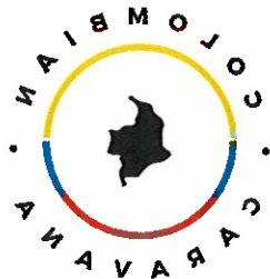
Caravana Internacional de Juristas

Las siguientes entidades se adhieren a este comunicado: